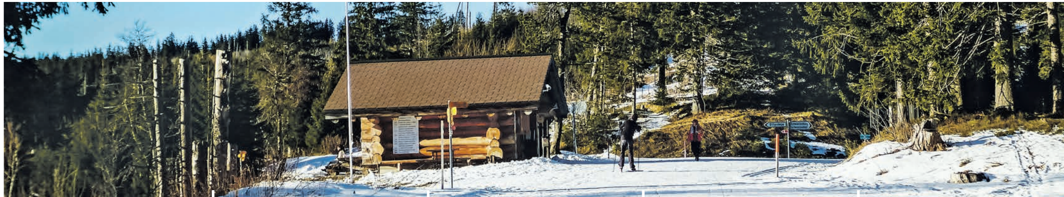
Süfthen im Ganterschgebiet