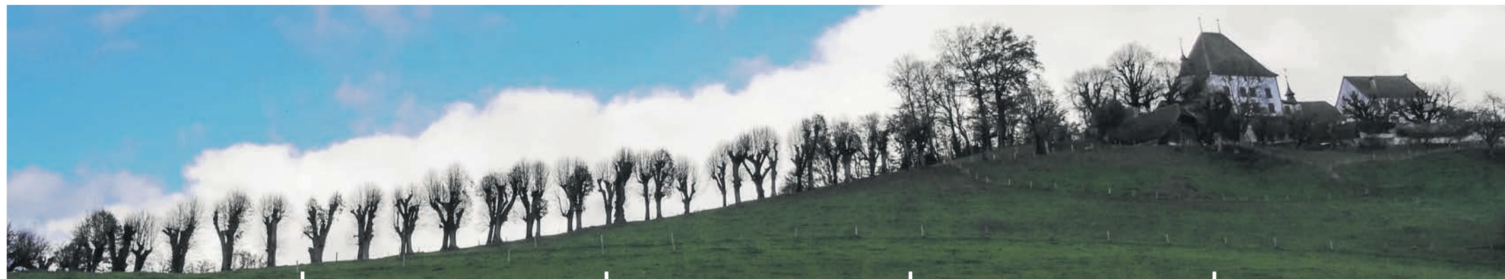
Schloss Burgstein