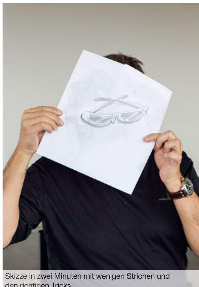
Skizze in zwei Minuten mit wenigen Strichen und den richtigen Tricks.

Abmeldung online über www.weloveyou.ch/seminare , per Telefon 031 818 01 10 oder per Talon an: WeLoveYou – Jordi AG, Aemmenmattstrasse 22, 3123 Belp