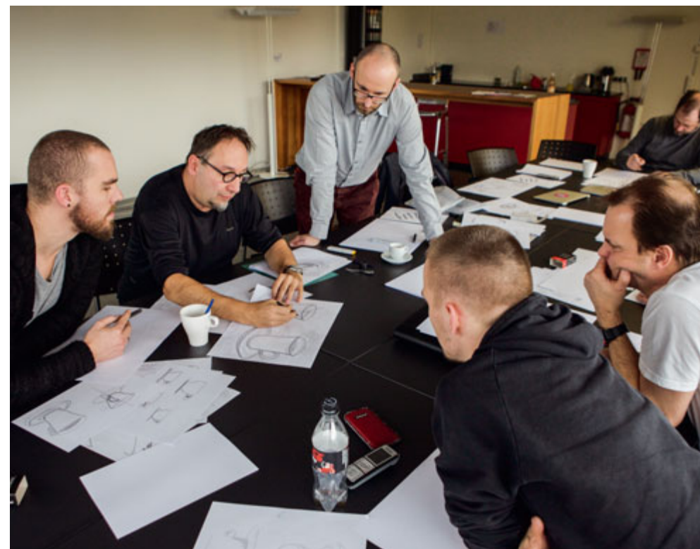
Faszinierte Seminarteilnehmer der Jordi AG

Die nächsten Scribbeln-Seminare finden am 23. März und 14. Juni statt. Infos und Anmeldung unter: weloveyou.ch/seminare/design/scribble