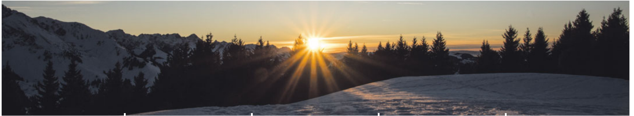
Die untergehende Sonne