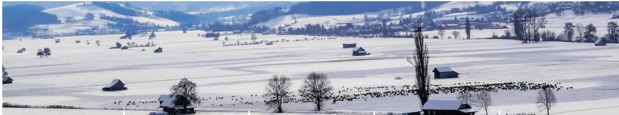
Wandernde Schafherde