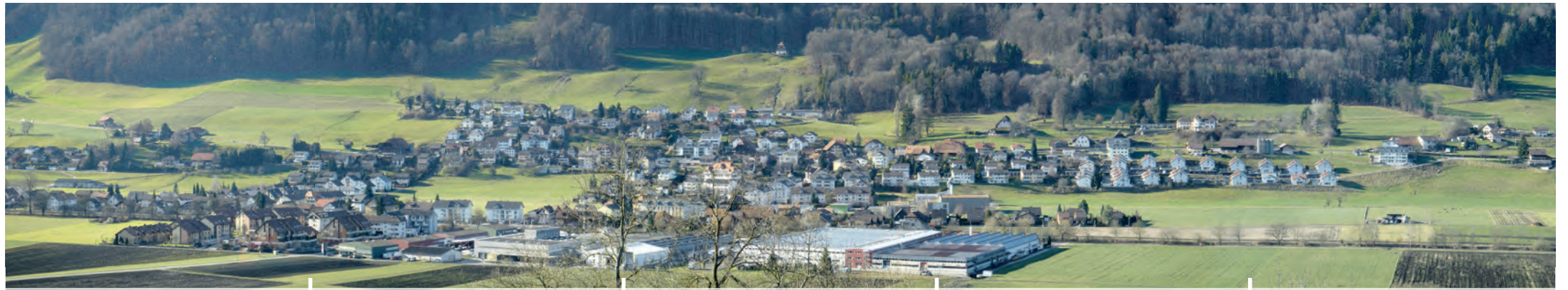
Toffen im Chabisland