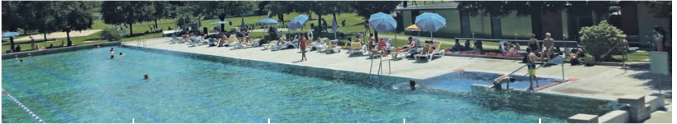
Giessenbad Belp