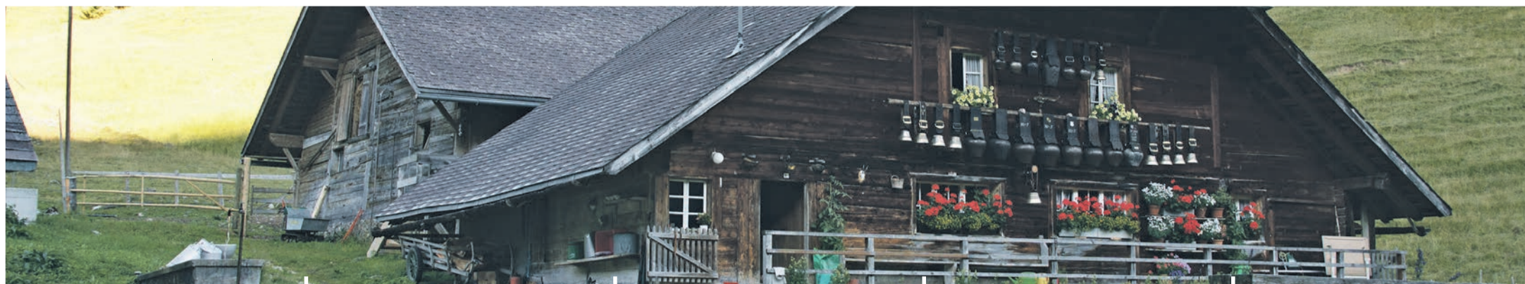
Sennhütte | Foto: Alfred Hostettler