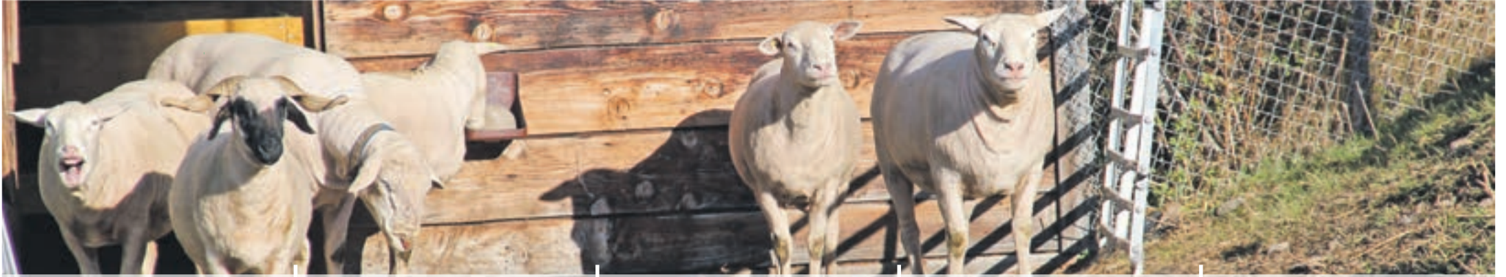
Geschorene Vierbeiner