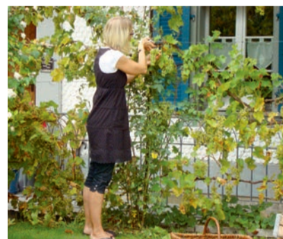
Trauben ernten, anliefern...

Heute leiten die fünfte und sechste Generation der Familie Riem die Aktiengesellschaft Riem, Daepf & Co. AG; sie beschäftigt 20 Mitarbeitende.