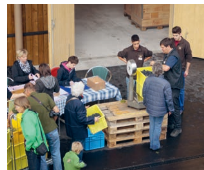
... wägen und Oechslegrad messen