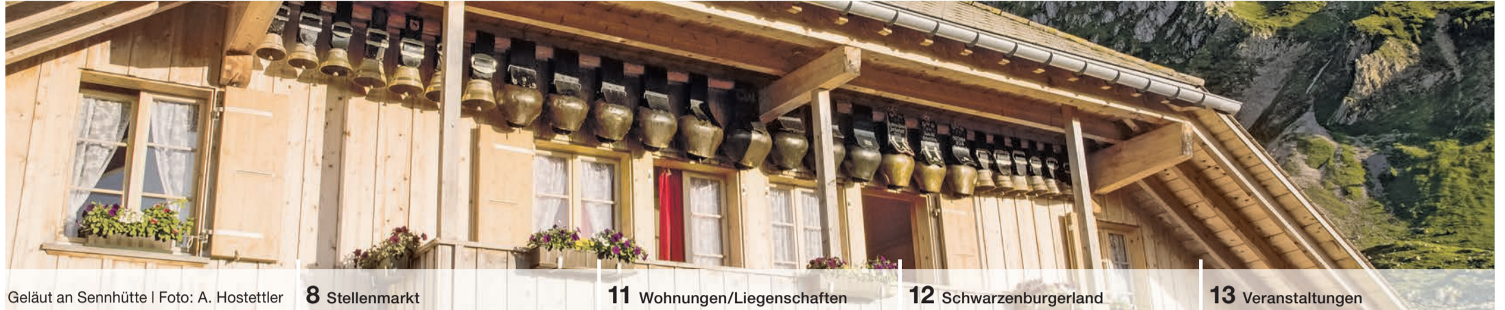
Geläut an Sennhütte