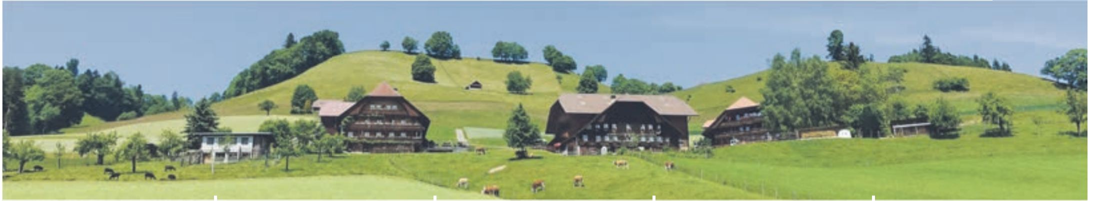
Rüschegg Gambach