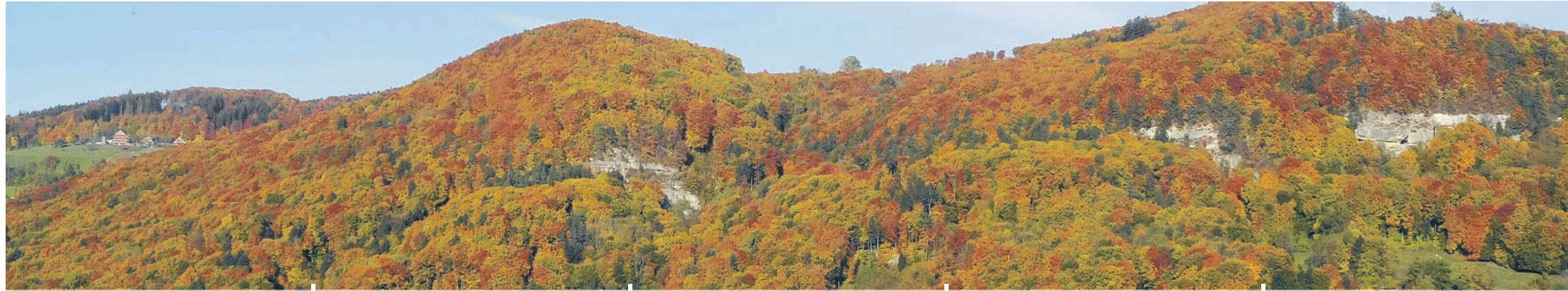
Herbstlicher Belpberg