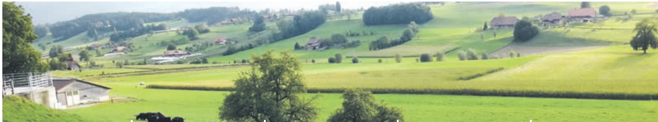
Kirchdorf, Limpach-Täli