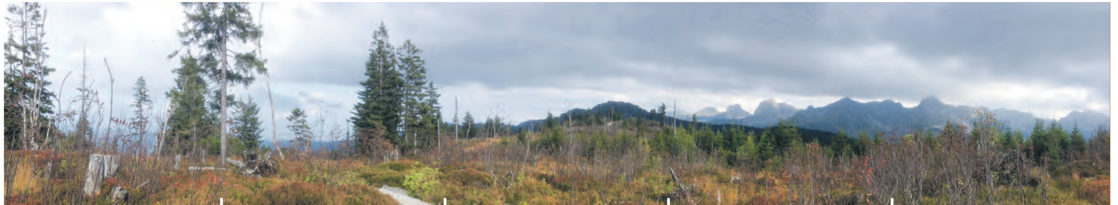
Gantrisch Panoramaweg