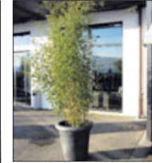
Bambus 2 m ab Fr. 79.-