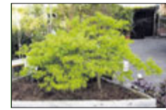
Jap. Zwergahorn bis 2 m

Lorbeer bis 3 m Buchs bis 3 m Magnolien bis 3 m Rhododendron Nadelgehölze bis 7 m