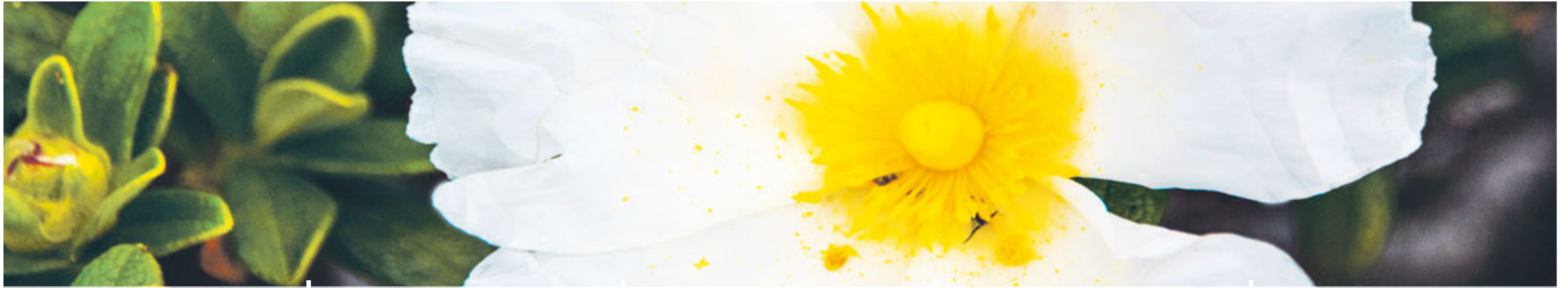
Der Sommer naht!