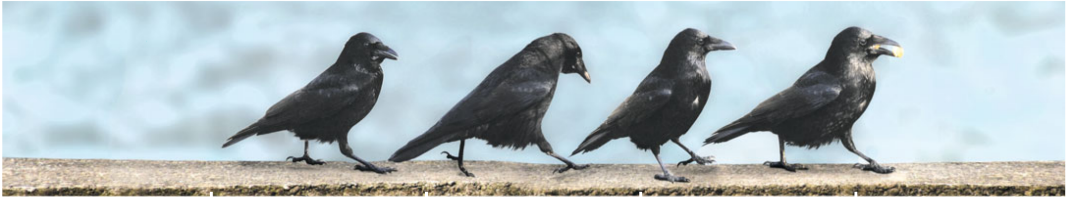
Immer dem Schnabel nach!

Belp | Gelterfingen | Gerzensee Guggisberg | Jaberg | Kaufdorf | Kirchdorf Kirchenthurnen | Lohnstorf | Mühledorf Mühlethurnen | Niedermuhlern | Noflen Riggisberg | Rüeggisberg | Rümliigen Rüschegg | Schwarzenburg | Toffen | Wald