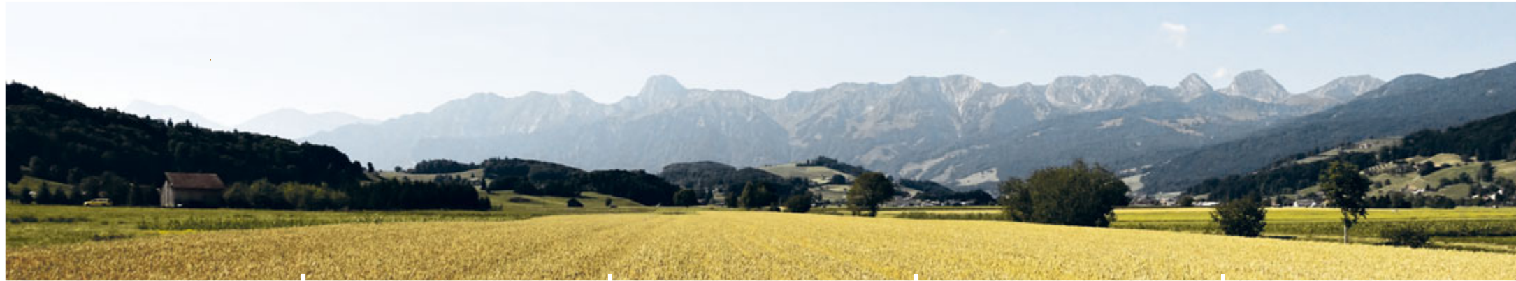
Gute Aussichten