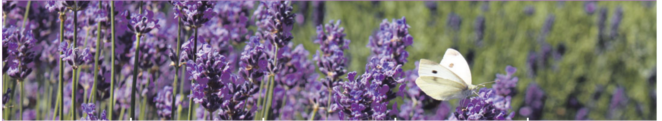
In der Ruhe liegt die Kraft