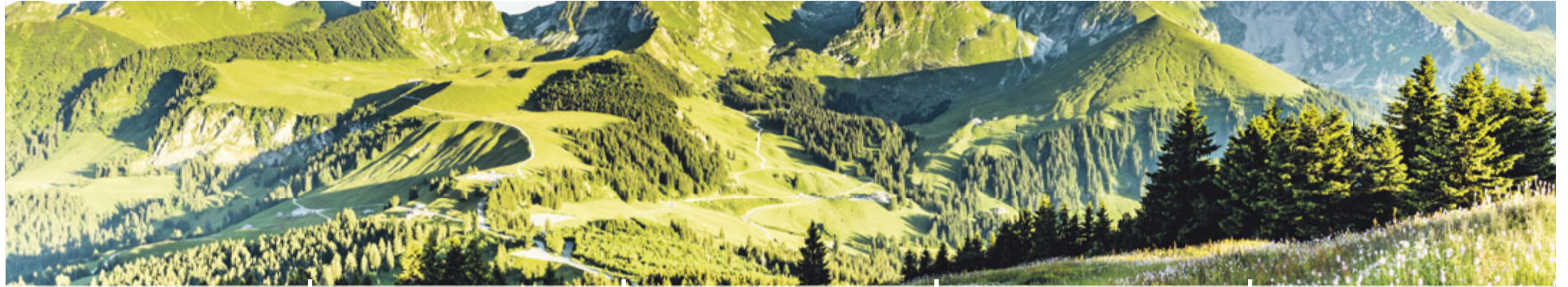
Grün leuchtet der Sommer!