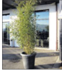
Bambus 2 m ab Fr. 79.-