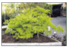
Jap. Zwergahorn bis 2 m

Lorbeer bis 3 m Buchs bis 3 m Magnolien bis 3 m Rhododendron Nadelgehölze bis 7 m