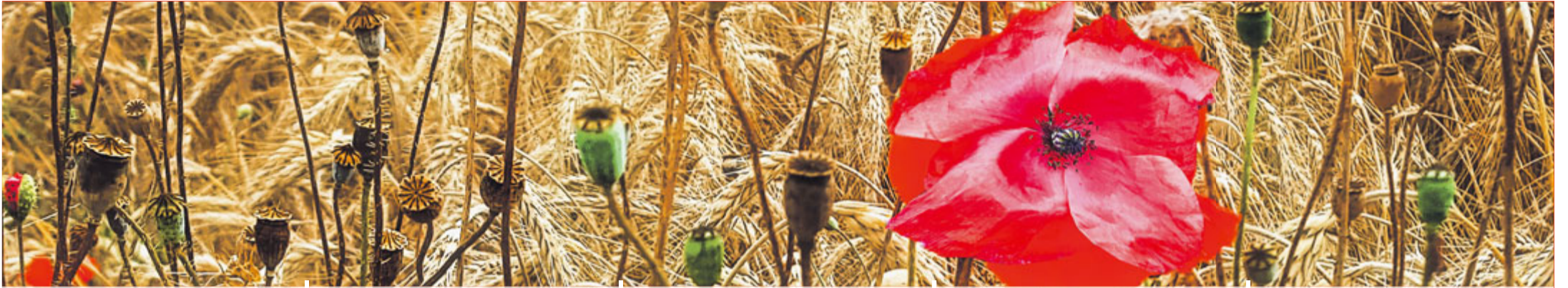
Mohnblume im Roggenfeld