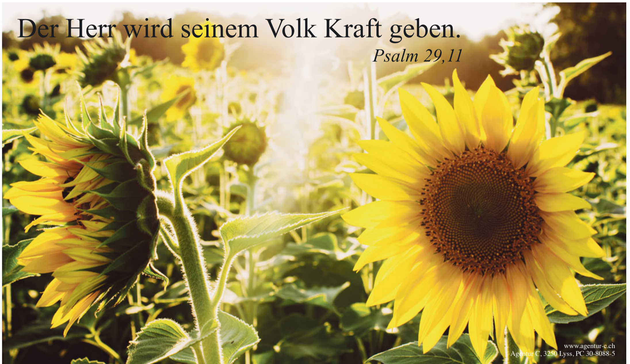
www.agentur-c.ch Agentur C, 3250 Lyss, PC 30-8088-5