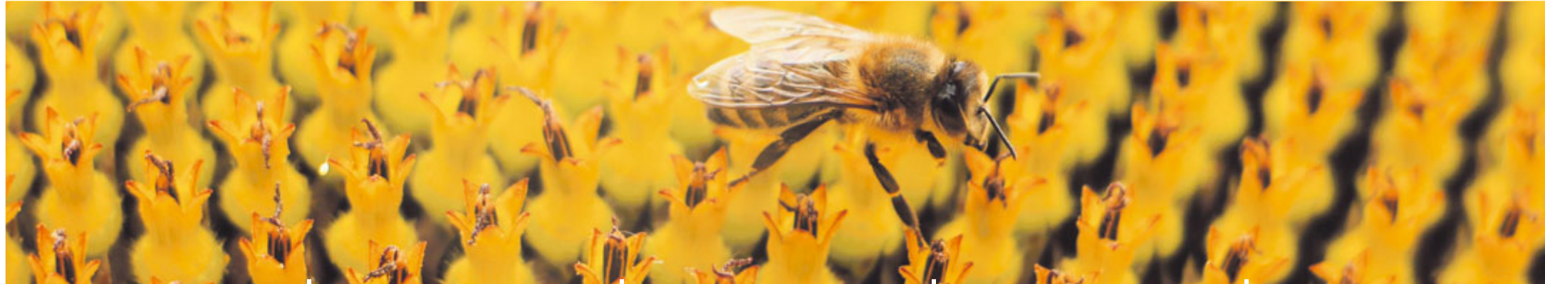
Biene auf Sonnenblume