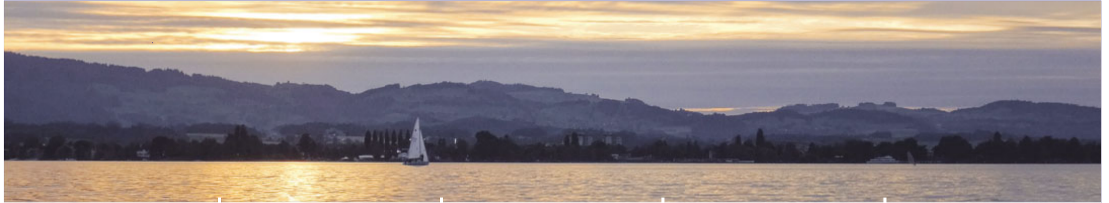
Blick Richtung Gantrischkette