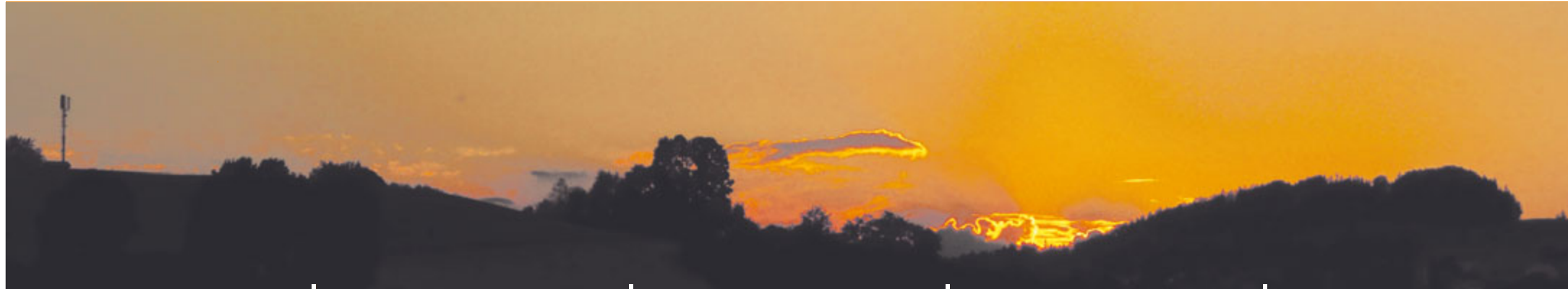
Sonnenuntergang im Gantrischpark