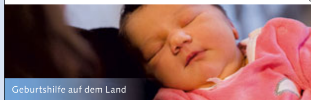
Geburtshilfe auf dem Land

Spital Münsingen, Geburtsabteilung/Hebammen, Krankenhausweg, 3110 Münsingen Tel. 031 682 81 60, www.spitalmuensingen.ch