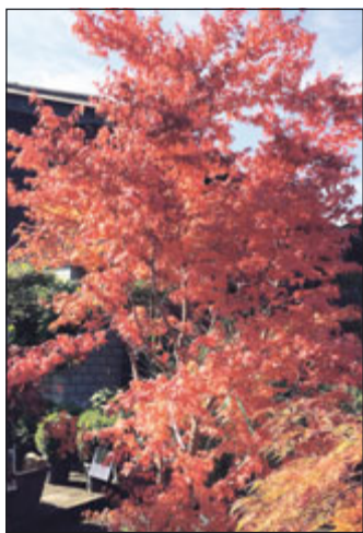
Japanischer Ahorn 30%

Gräser, Bambus, Japanische Ahorne, Palmen usw.