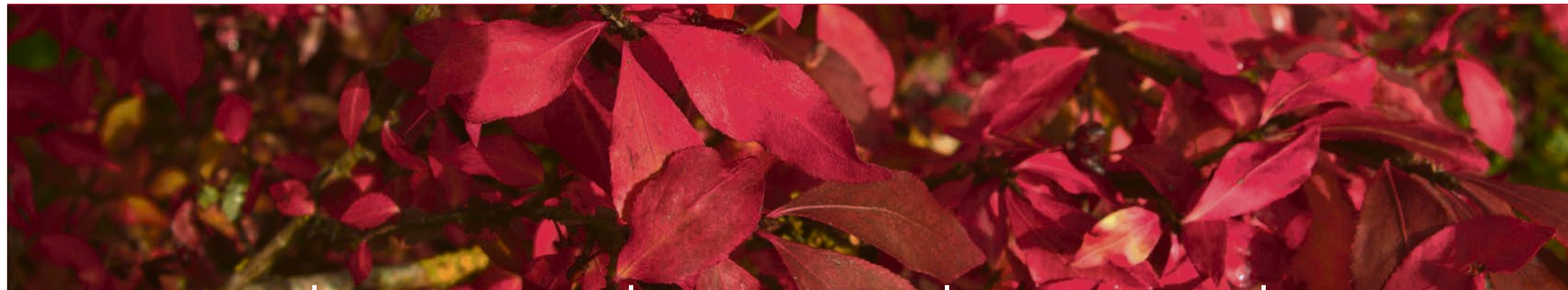
Bald fallen die Blätter.