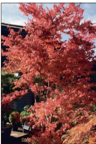
Japanischer Ahorn 30%

Gräser, Bambus, Japanische Ahorne, Palmen usw.