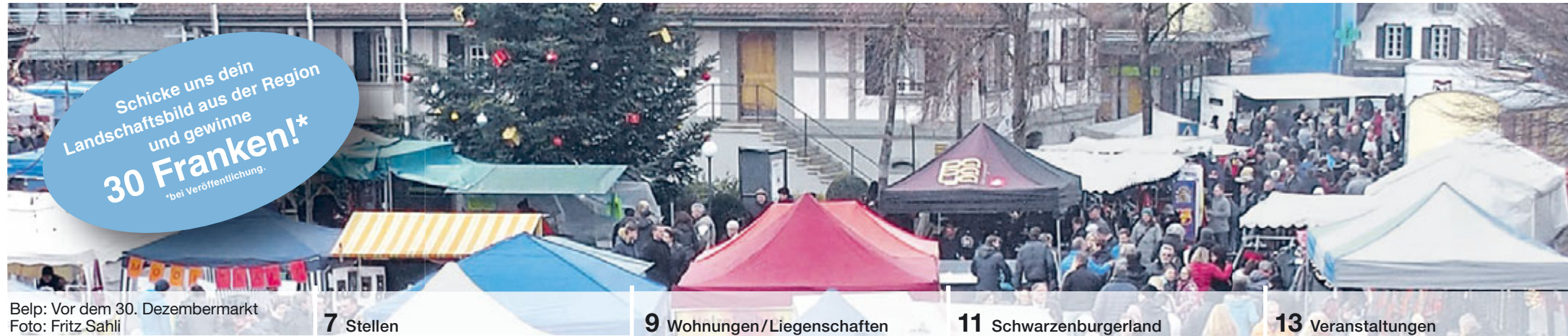
Belp: Vor dem 30. Dezembermarkt