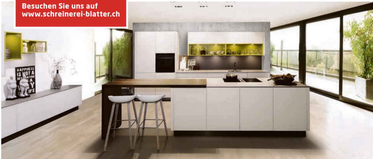
Schreinerei Blatter AG, Schulhausstrasse 18, 3086 Zimmerwald, T +31 819 34 43, www.schreinerei-blatter.ch

Besuchen Sie uns auf www.schreinerei-blatter.ch