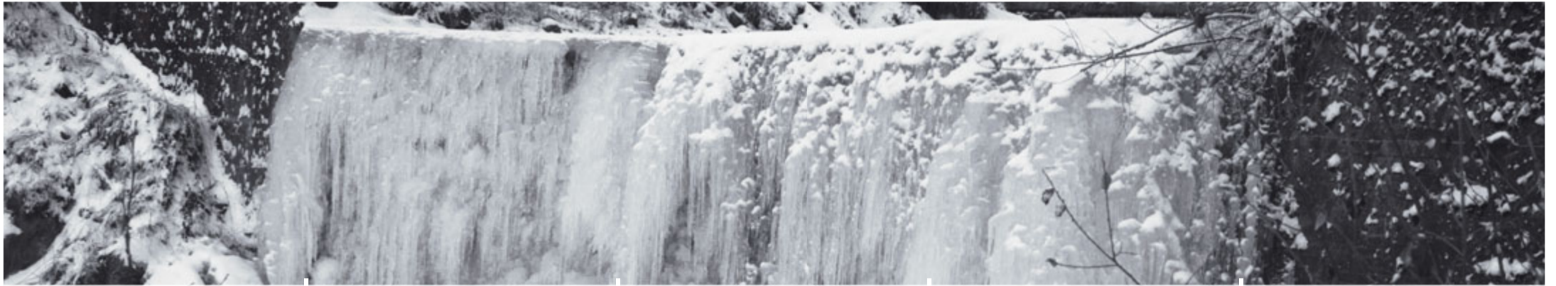
Gefrorener Wasserfall