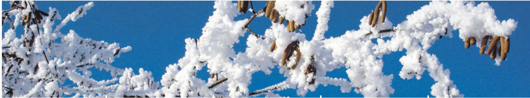
Rauhreif in der Gantersch-Region