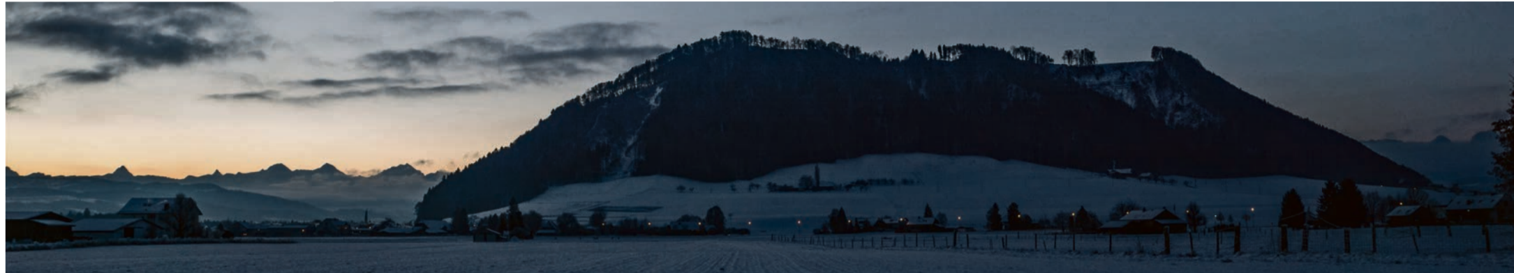
Sonnenaufgang in Belp