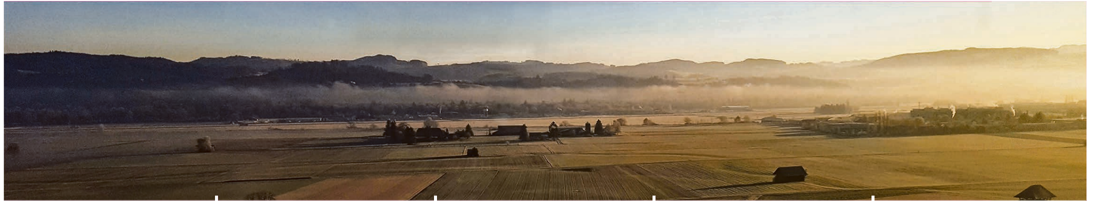
Der Berner Flughafen im Morgennebel