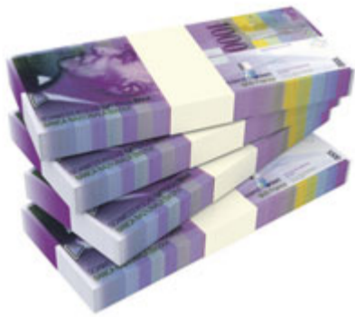
Erhöhung der Strompreise für unnütze Subventionen

Heute hat die Schweiz eine sichere und wirtschaftliche Stromversorgung. Dank einer starken heimischen Produktion ist Strom jederzeit zu vernünftigen Preisen verfügbar.