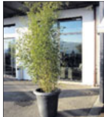
Bambus 2 m ab Fr. 79.-