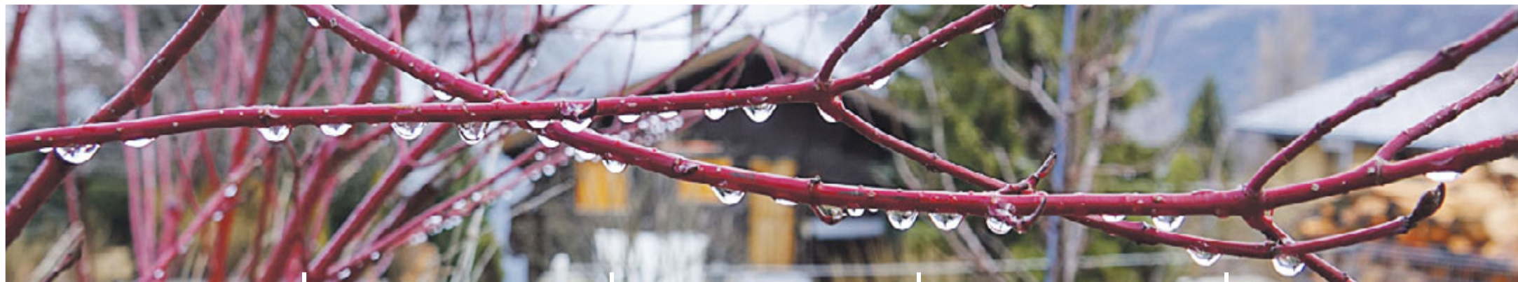
Walter von Niederhäusern Foto: Tautropfen