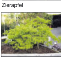
Jap. Zwergahorn bis 2 m

Lorbeer bis 3 m Buchs bis 3 m Magnolien bis 3 m Rhododendron Nadelgehölze bis 7 m