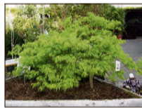
Jap. Zwergahorn bis 2 m

Lorbeer bis 3 m Buchs bis 3 m Magnolien bis 3 m Rhododendron Nadelgehölze bis 7 m