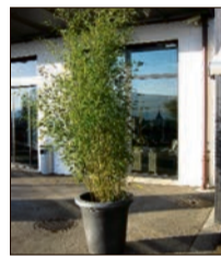
Bambus 2 m ab Fr. 79.-