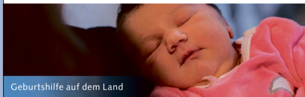
Geburtshilfe auf dem Land

Spital Münsingen, Geburtsabteilung/Hebammen, Krankenhausweg, 3110 Münsingen Tel. 031 682 81 60, www.spitalmuensingen.ch