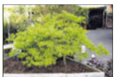
Jap. Zwergahorn bis 2 m

Lorbeer bis 3 m Buchs bis 3 m – 70% Magnolien bis 3 m Rhododendron Nadelgehölze bis 7 m