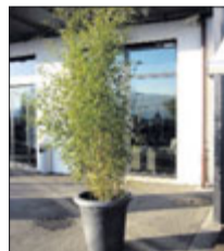
Bambus 2 m ab Fr. 79.–