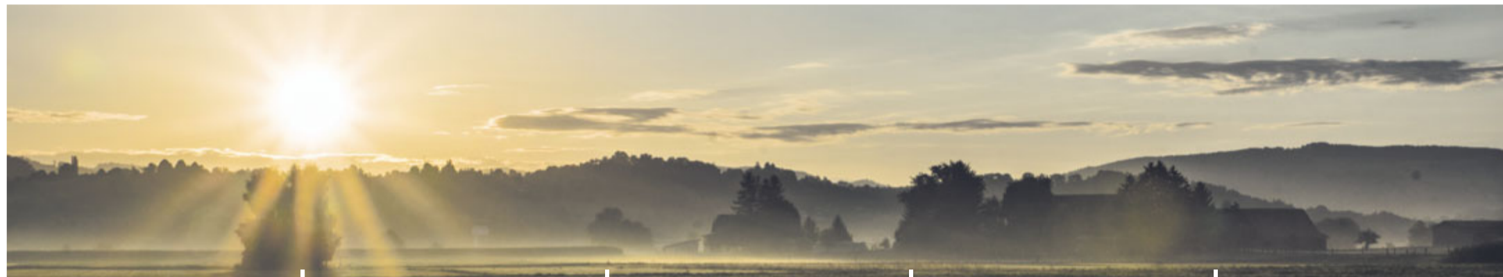
Sonnenaufgang, Belpmoos