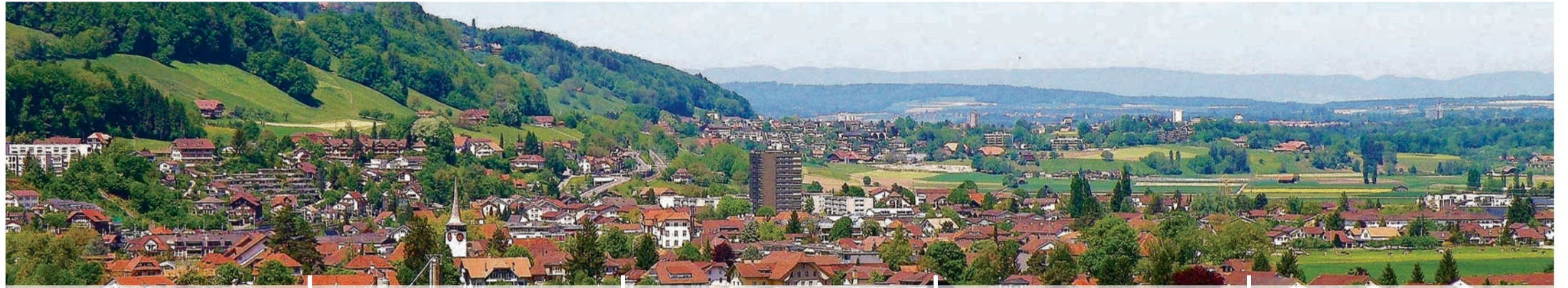
Belp lädt zu volkstümlichem Fest ein

Belp | Gelterfingen | Gerzensee Guggisberg | Jaberg | Kaufdorf | Kirchdorf Kirchenturnen | Lohnstorf | Mühledorf Mühlethurnen | Niedermuhlern | Noflen Riggisberg | Rüeggisberg | Rümli Rüschegg | Schwarzenburg | Toffen | Wald