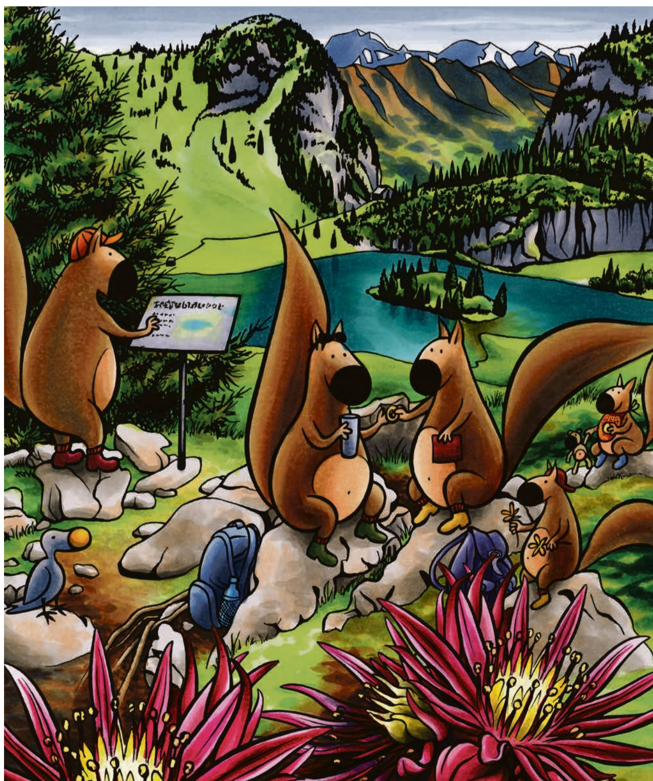
Auflösung in der nächsten Ausgabe.