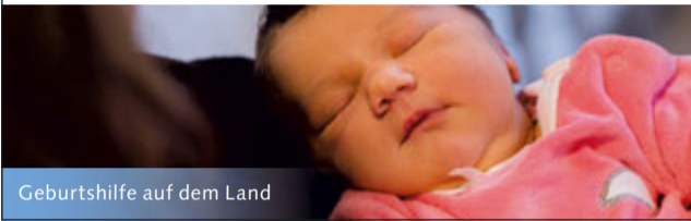
Geburtshilfe auf dem Land

Spital Münsingen, Geburtsabteilung/Hebammen, Krankenhausweg, 3110 Münsingen Tel. 031 682 81 60, www.spitalmuensingen.ch