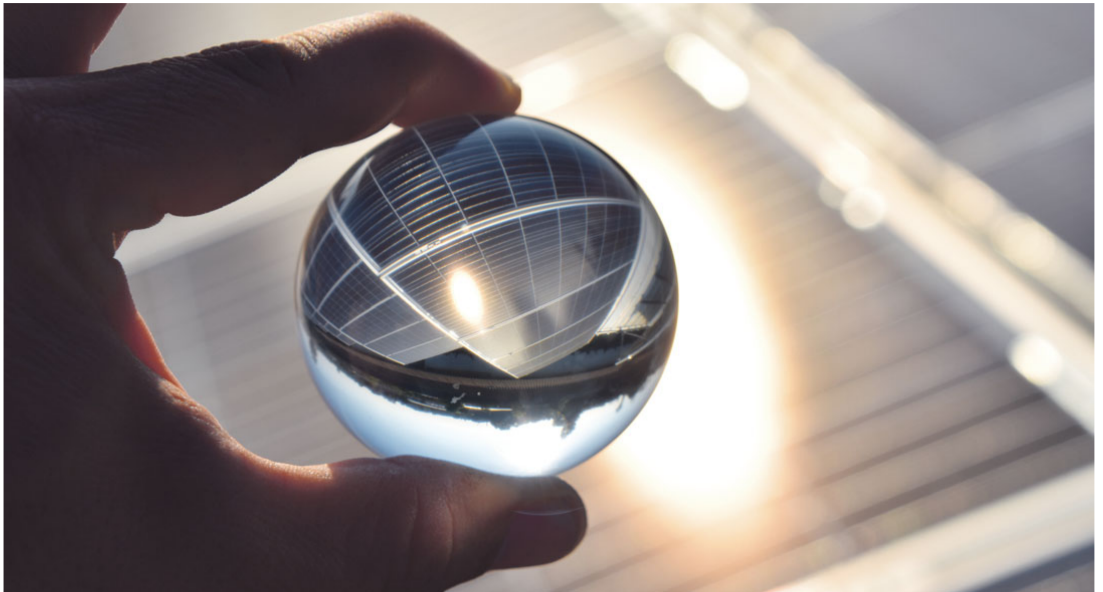
Diese Frage ist für viele ein Blick in die Glaskugel: Rentiert eine Solaranlage auf Wohnbauten?

Die Zeiten, in denen mit einer Photovoltaikanlage dank Unterstützung der kostendeckenden Einspeisevergütung KEV Geld verdient werden konnte, sind in der Schweiz vorbei. Wer heute eigenen Solarstrom produziert, benötigt einen etwas längeren Atem und die Überzeugung, etwas Gutes Sinnvolles zu tun im Sinn von mehr Eigenständigkeit. Es fragen sich viele Besitzer von Wohnbauten: Rechnet sich eine Solaranlage auf Wohnbauten (noch)? Der erfolgversprechendste Weg zu einer rentablen Anlage ist ein hoher Eigenverbrauchsanteil. Denn jede Kilowattstunde, die nicht für teures Geld beim Elektrizitätswerk bezogen werden muss, hilft, die eigene Anlage wirtschaftlich zu amortisieren. Der Grund dafür ist, dass für den selbst erzeugten Strom keine Netznutzungsentgelte und weitere Abgaben bezahlt werden müssen.