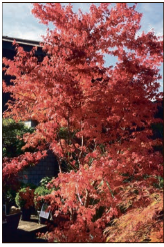
Japanischer Ahorn 30%

Gräser, Bambus, Japanische Ahorne, Palmen usw.