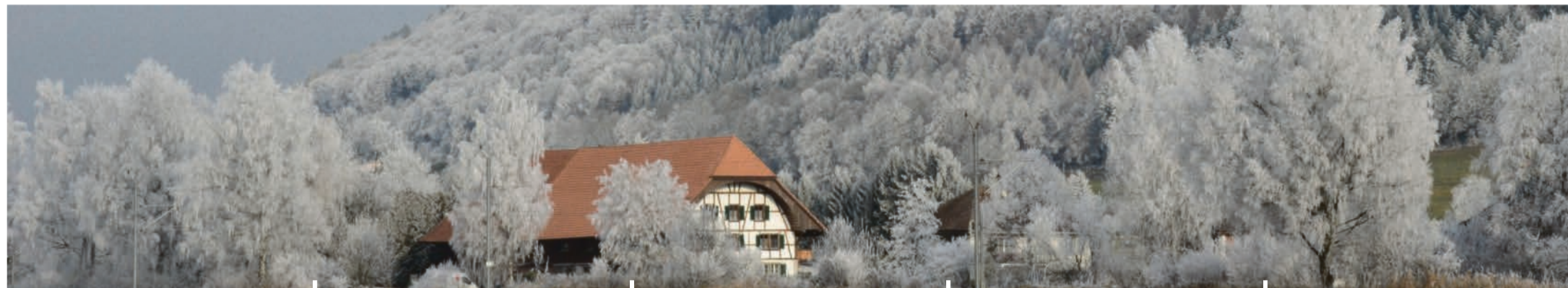
Belper Talgut im Frostmantel