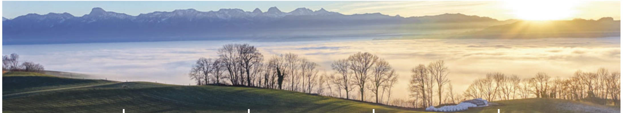
Belpberg mit Stockhornkette