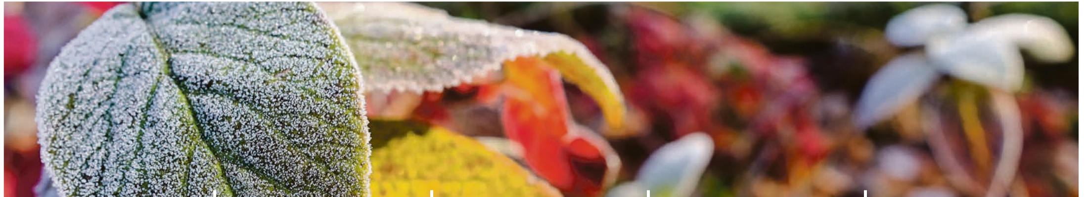
Wenn der Winter den Herbst ablöst ...