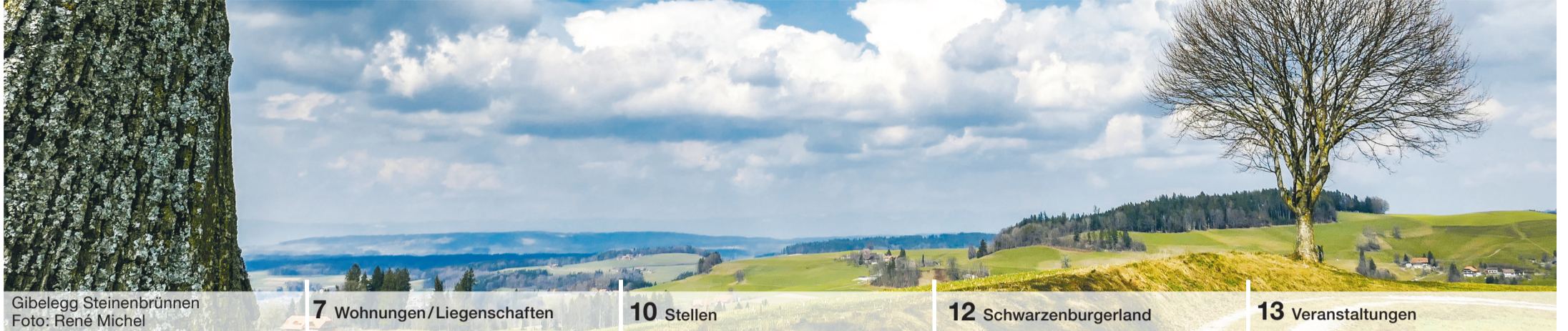
Gibelegg Steinenbrünnen

Amthlicher Anzeiger für die Gemeinden: Belp | Gelterfingen | Gerzensee Guggisberg | Jaberg | Kaufdorf | Kirchdorf Kirchenthurnen | Lohnstorf | Mühledorf Mühlethurnen | Niedermuhlern | Noflen Riggisberg | Rüeggisberg | Rümliigen Rüschegg | Schwarzenburg | Toffen | Wald