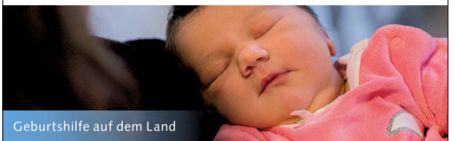
Geburtshilfe auf dem Land

Spital Münsingen, Geburtsabteilung/Hebammen, Krankenhausweg, 3110 Münsingen Tel. 031 682 81 60, www.spitalmuensingen.ch