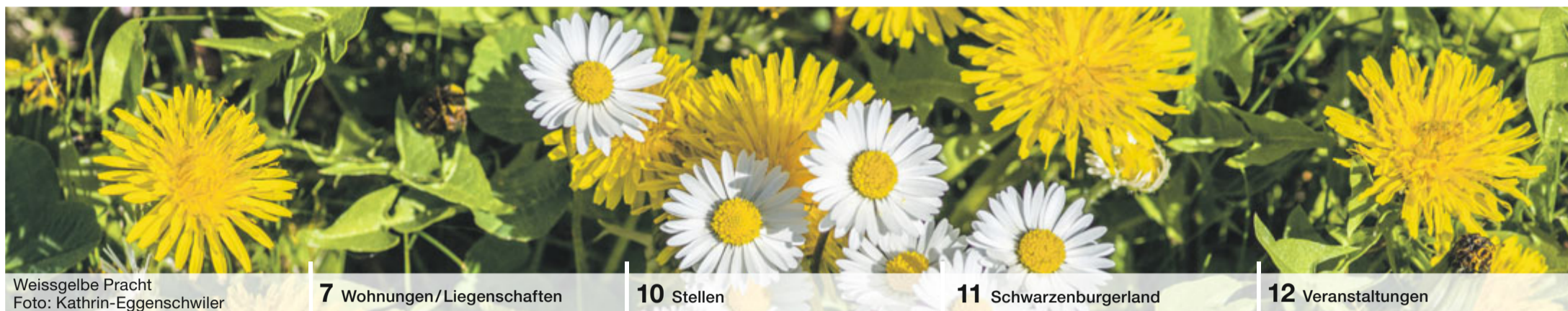
Weissgelbe Pracht