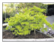
Jap. Zwergahorn bis 2 m

Lorbeer bis 3 m Buchs bis 3 m Magnolien bis 3 m Rhododendron Nadelgehölze bis 7 m