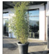
Bambus 2 m ab Fr. 79.-