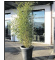
Bambus 2 m ab Fr. 79.-