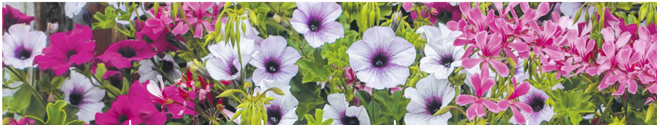
Sommerflor bei Rüeggisberg