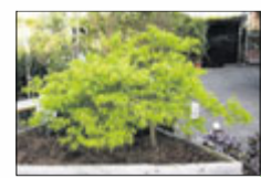
Jap. Zwergahorn bis 2 m