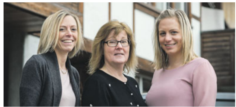
Visana-Team Geschäftsstelle Schwarzenburg

Persönliche Beratung ohne Zeitdruck Haben Sie Fragen zum Wechsel der Krankenkasse oder des Versicherungsmodells? Dann rufen Sie uns einfach an, oder kommen Sie direkt bei uns auf der Geschäftsstelle Schwarzenburg vorbei. Wir haben Zeit für Sie und unterbreiten Ihnen gerne einen Vorschlag, welches Grundversicherungsmodell am besten zu Ihnen und Ihrer Familie passt.