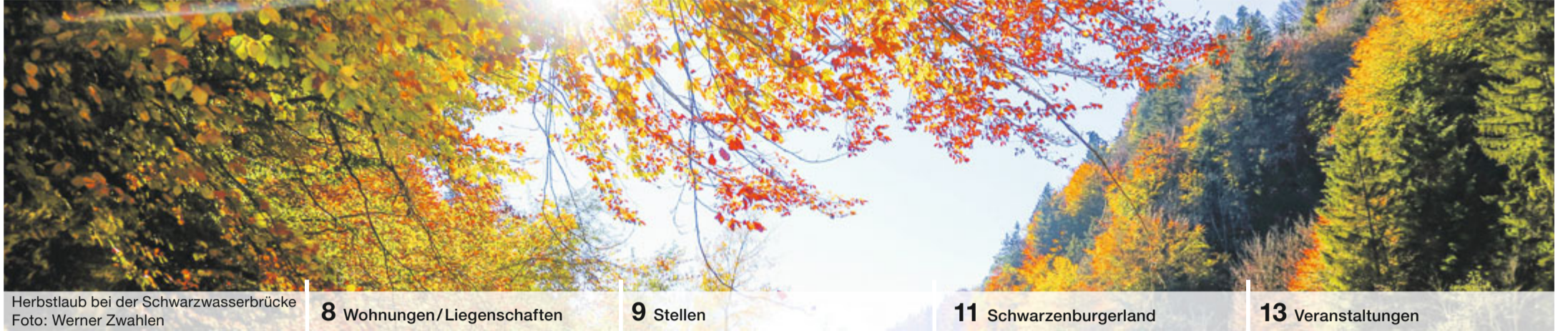
Herbstlaub bei der Schwarzwasserbrücke