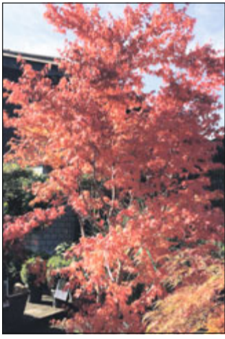
Japanischer Ahorn 30%

Gräser, Bambus, Japanische Ahorne, Palmen usw.