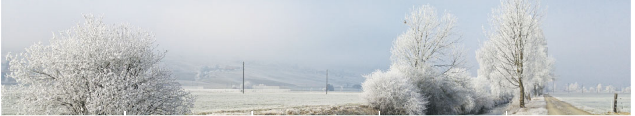
Eisige Kälte an der Gürbe