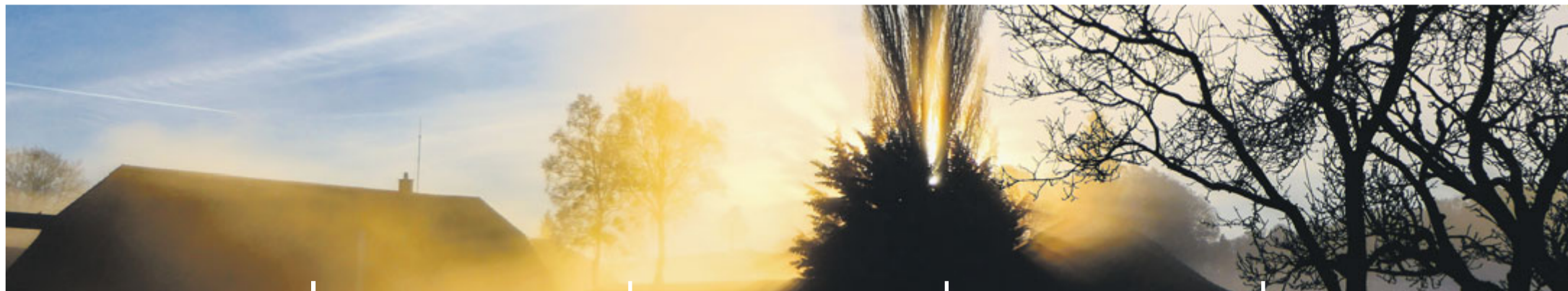
Niedermuhlern Sonnenaufgang