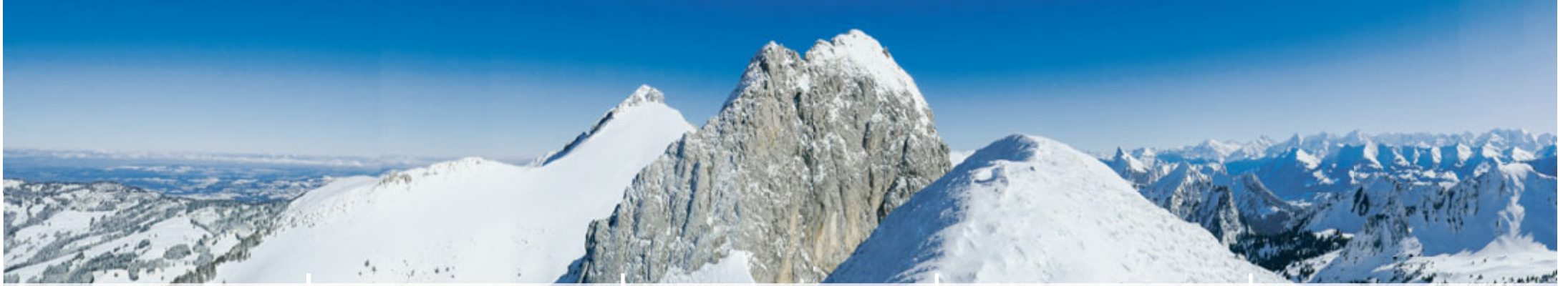
Alpiglemäre Gipfel Blick