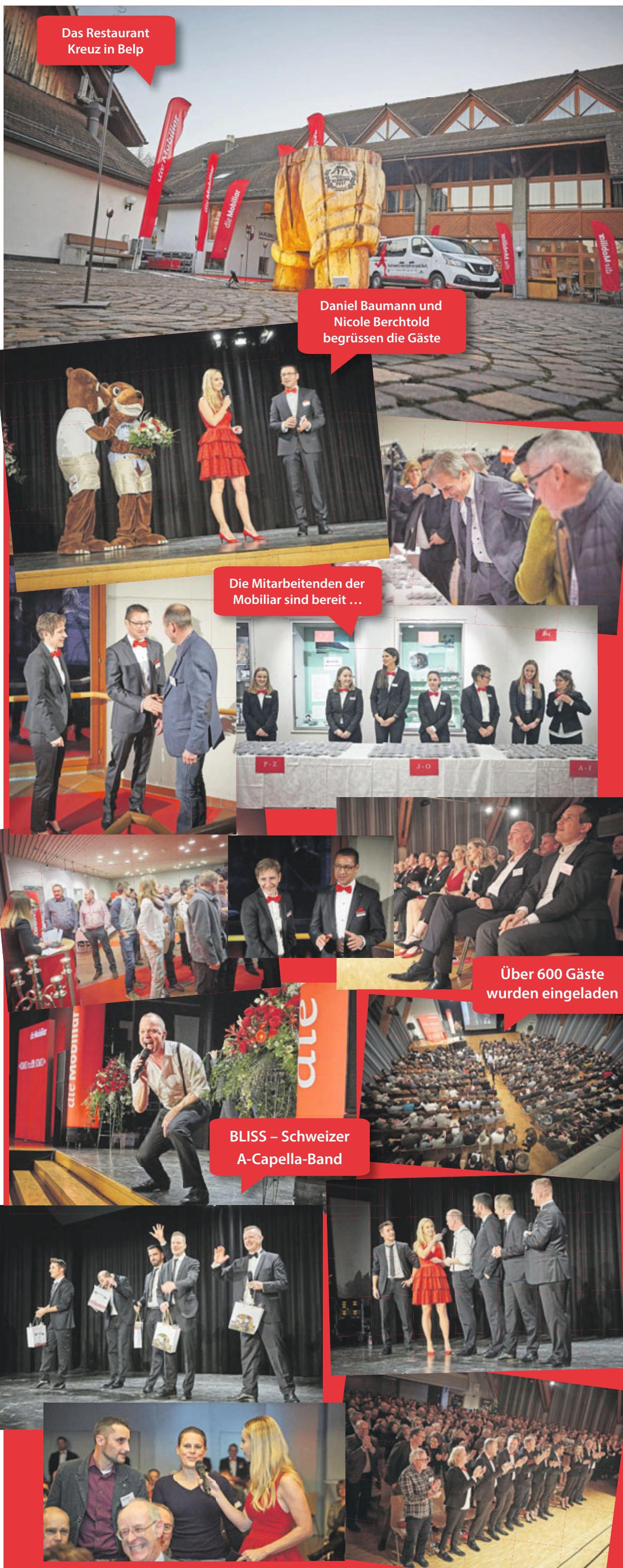
Das Restaurant Kreuz in Belp

die Mobiliar Generalagentur Belp Bahnhofstrasse 11 3123 Belp 031 818 44 44