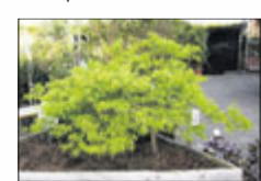
Jap. Zwergahorn bis 2 m

Lorbeer bis 3 m Buchs bis 3 m Magnolien bis 3 m Rhododendron Nadelgehölze bis 7 m