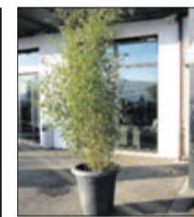
Bambus 2 m ab Fr. 79.–