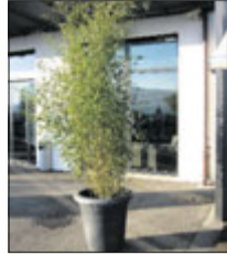
Bambus 2 m ab Fr. 79.-