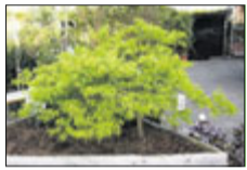
Jap. Zwergahorn bis 2 m

Lorbeer bis 3 m Buchs bis 3 m Magnolien bis 3 m Rhododendron Nadelgehölze bis 7 m