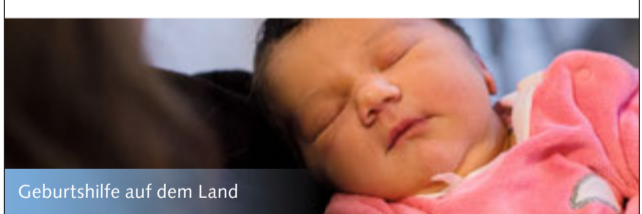
Geburtshilfe auf dem Land

Spital Münsingen, Geburtsabteilung/Hebammen Krankenhausweg, 3110 Münsingen Telefon +41 31 682 81 60, www.spitalmuensingen.ch