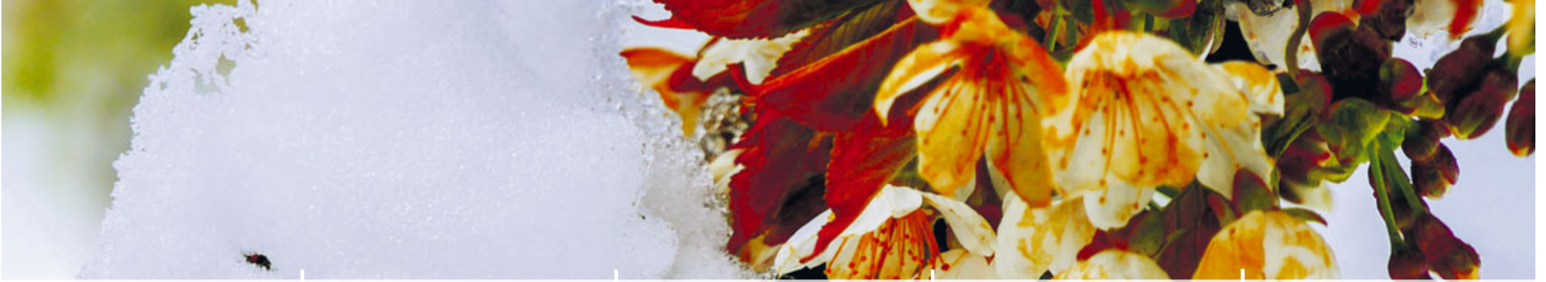
Winterlicher Frühling in Guggisberg