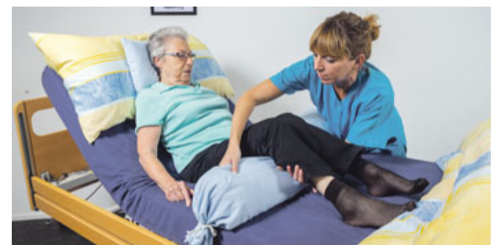
Pflegehelfer/-innen leisten sinnvolle Arbeit in direktem Kontakt zu den Menschen.